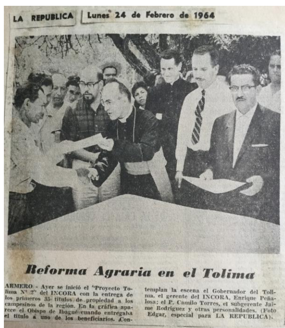
Figura 2. Las medidas concretas de implementación de la reforma